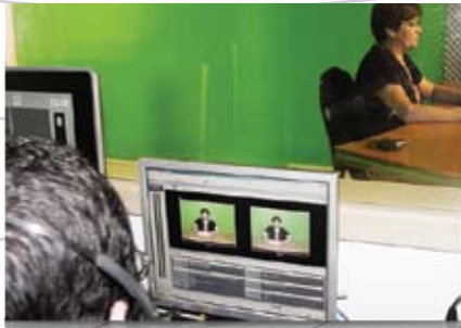
Sala de controle